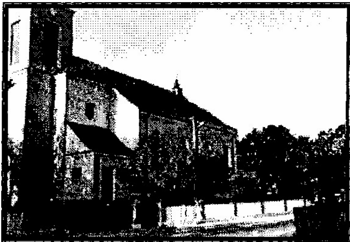
Fotografia 3. Kościół parafialny pod wezwaniem św. Stanisława Biskupa Męczennika w Serokomli

pobronowano końmi, aby zatrzeć ślady. W miejscu tym, w Józefowie, znajdują się symbole męczeństwa: krzyż i pomnik przedstawiający postać kobiety bolejącej, gdyż rodziny pomordowanych dołożyły wszelkich starań, by miejsce to upamiętnić. W 16 lat od chwili masowej kaźni, tj, 19 kwietnia 1956 roku dokonano ekshumacji zwłok ofiar i przeniesiono je na cmentarz parafialny w Serokomli. Pochowano ich w 16 zbiorowych mogiłach, nad którymi wzniesiono murowany obelisk.