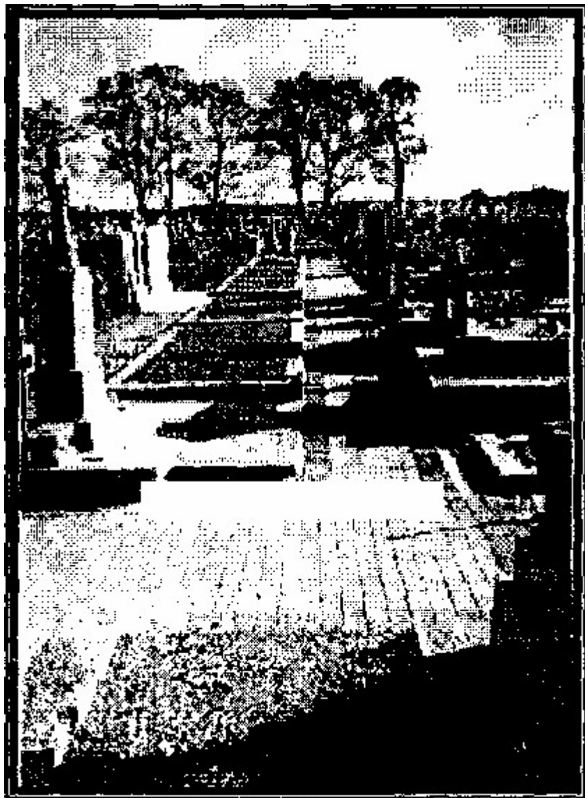
Fotografia 2. Mogiły poległych żołnierzy SGO Polesie ". Cmentarz w Serokomli